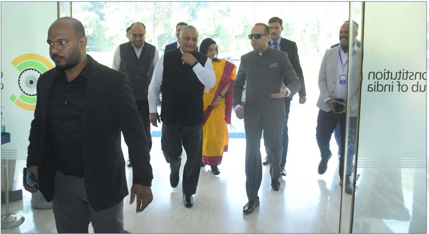
Welcoming and Escorting of the Chief Guest, General (Dr.) Vijay Kumar Singh (Retd.), Hon'ble Minister of State