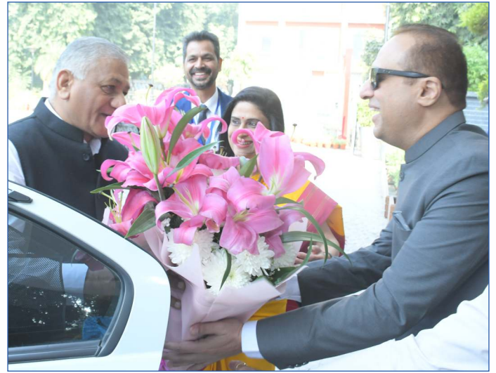
Arrival of Chief Guest, General (Dr.) Vijay Kumar Singh (Retd.), Hon'ble Minister of State