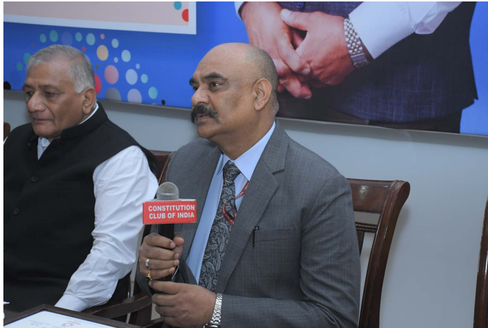
Ashok Kumar, Postmaster General (Operations) Delhi Circle, India Post answering the media