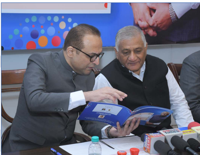
Briefing the Chief Guest on the Dias