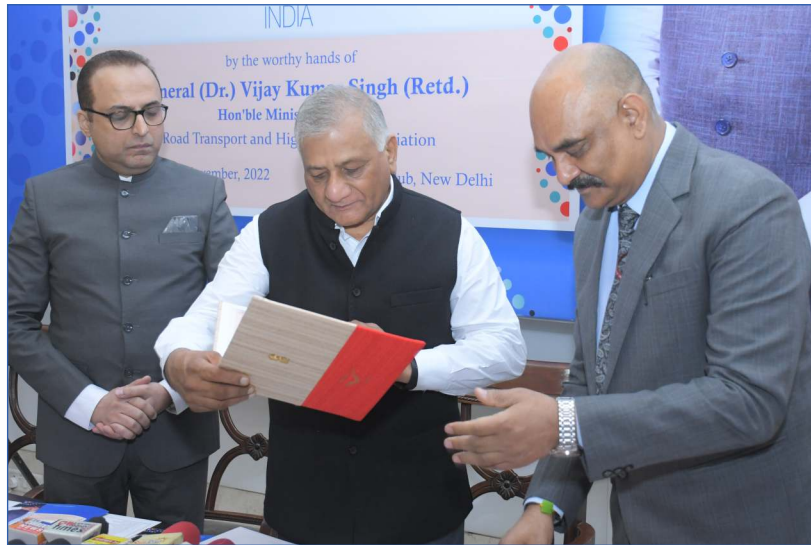
India Post presenting the first album to the Minister