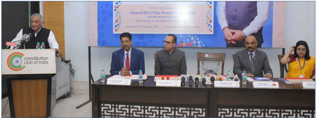
Address by the Chief Guest, General (Dr.) Vijay Kumar Singh (Retd.), Hon'ble Minister of State