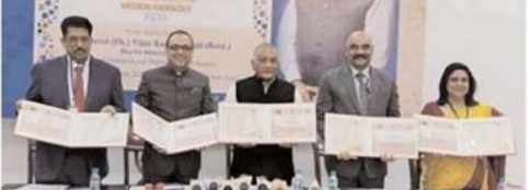
वैभव न्यूज़ ■ नई दिल्ली