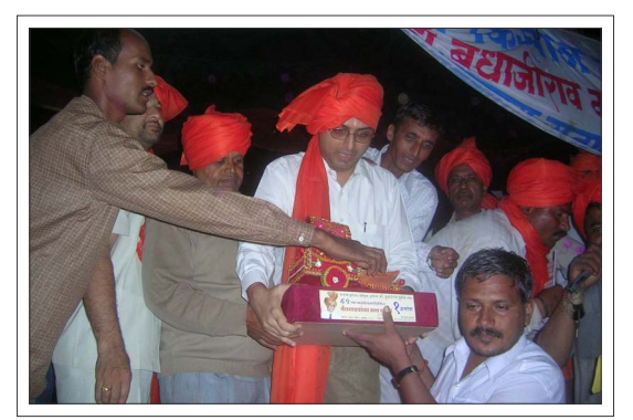
Farmers rally & Bullock cart race at Satara

Sundeep's step in this direction is to create a political atmosphere for the cause.